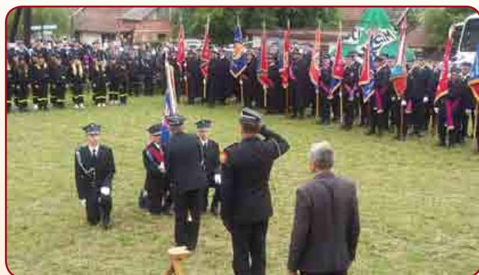
Jubileusz 70-lecia OSP w Kadczy