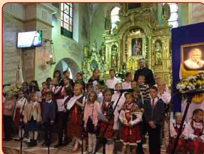
Dzień Papieski w Łącku