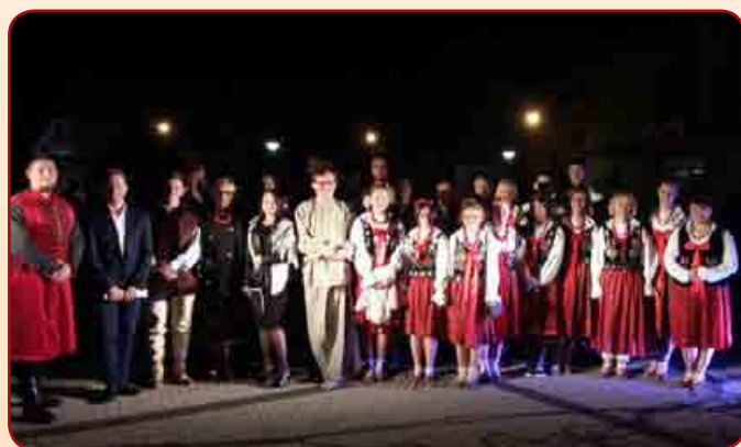
Narodowe Czytanie „Wesela” w Łącku