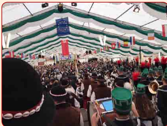
Orkiestra z Łącka na Festiwalu w Bad Schlema